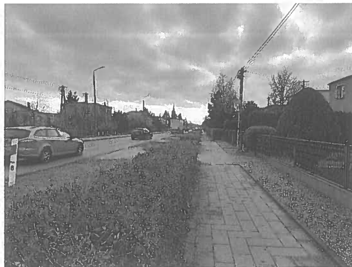
Fot.4. DK25 km 166+800 str. P kierunek Inowrocław