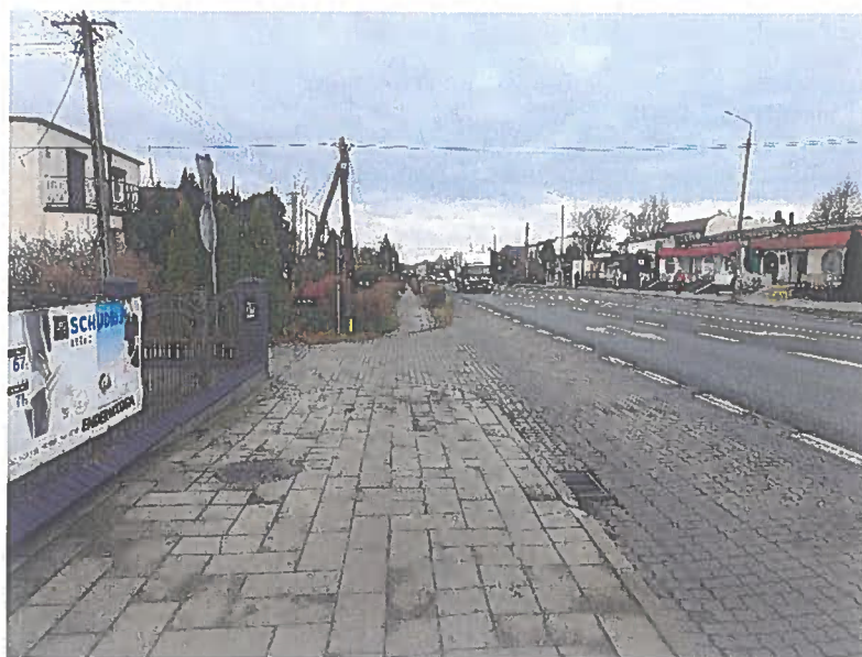
Fot.7. DK25 km 167+100 str. P kierunek Bydgoszcz