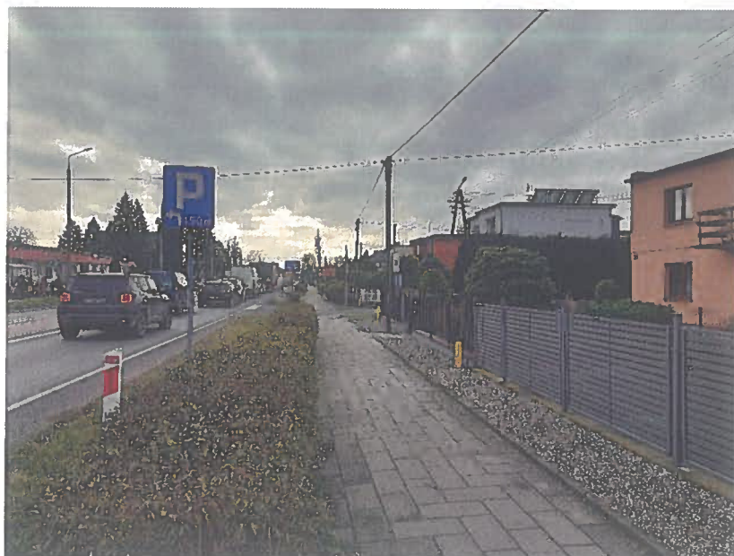
Fot.6. DK 25 km 167+000 str. P kierunek Inowrocław