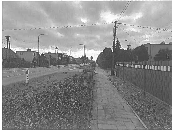
Fot.3. DK25 km 166+700 str. P kierunek Inowrocław