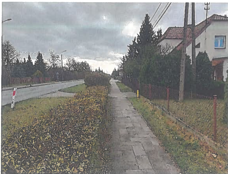
Fot.2. DK25 km 166+600 str. P kierunek Inowrocław