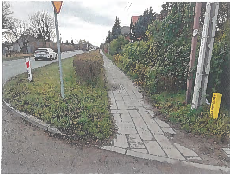
Fot.1. DK25 km 166+495 str. P kierunek Inowrocław