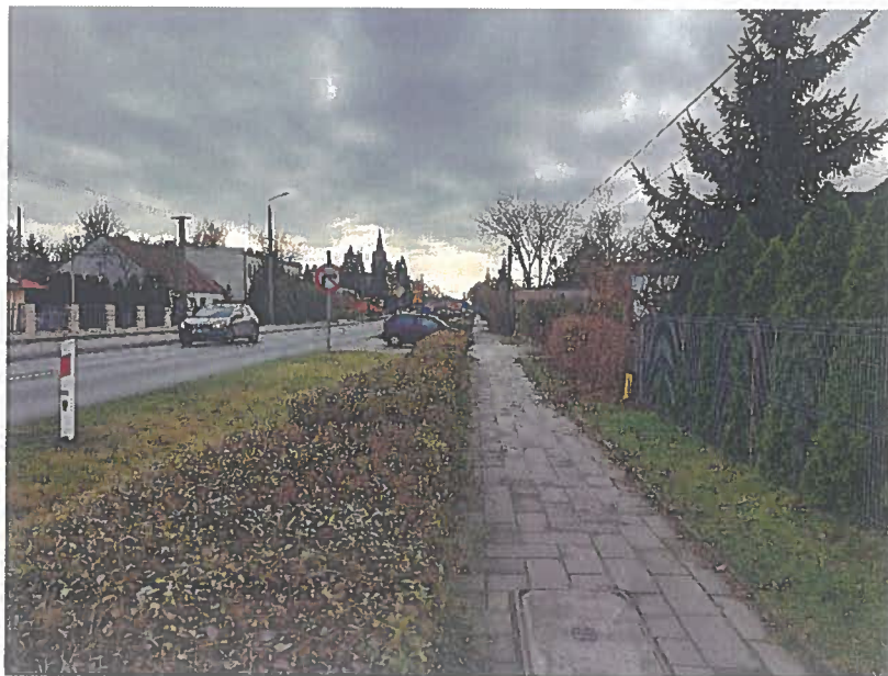
Fot.5. DK25 km 166+900 str. P kierunek Inowrocław