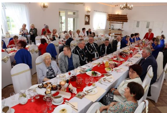
23.05. - wtorek, zajęcia ceramiczne ze słodkim poczęstunkiem.