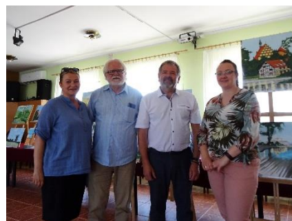
17.06. - sobota, w Brzozie odbył się Piknik Ekologiczny „Dorośli i dzieci, dbając o przyrodę, segregują śmieci”. Organizator: Gminny Ośrodek Kultury i Urząd Gminy w Nowej Wsi Wielkiej. Projekt finansowany ze środków Wojewódzkiego Funduszu Ochrony Środowiska i Gospodarki Wodnej w Toruniu. Pogoda dopisała. Było sympatycznie i ekologicznie.