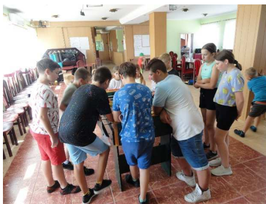
10.07. - niedziela „Letni Turniej Piłki Siatkowej”, organizator: GOKNWW.